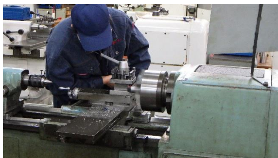
旋盤コース（切削作業）

令和2年度の機械科の実習がスタートしました。生徒1人ひとりが各コースにて専門的な資格取得を目指します！