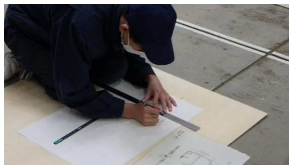
設備コース（配管の図面作成）