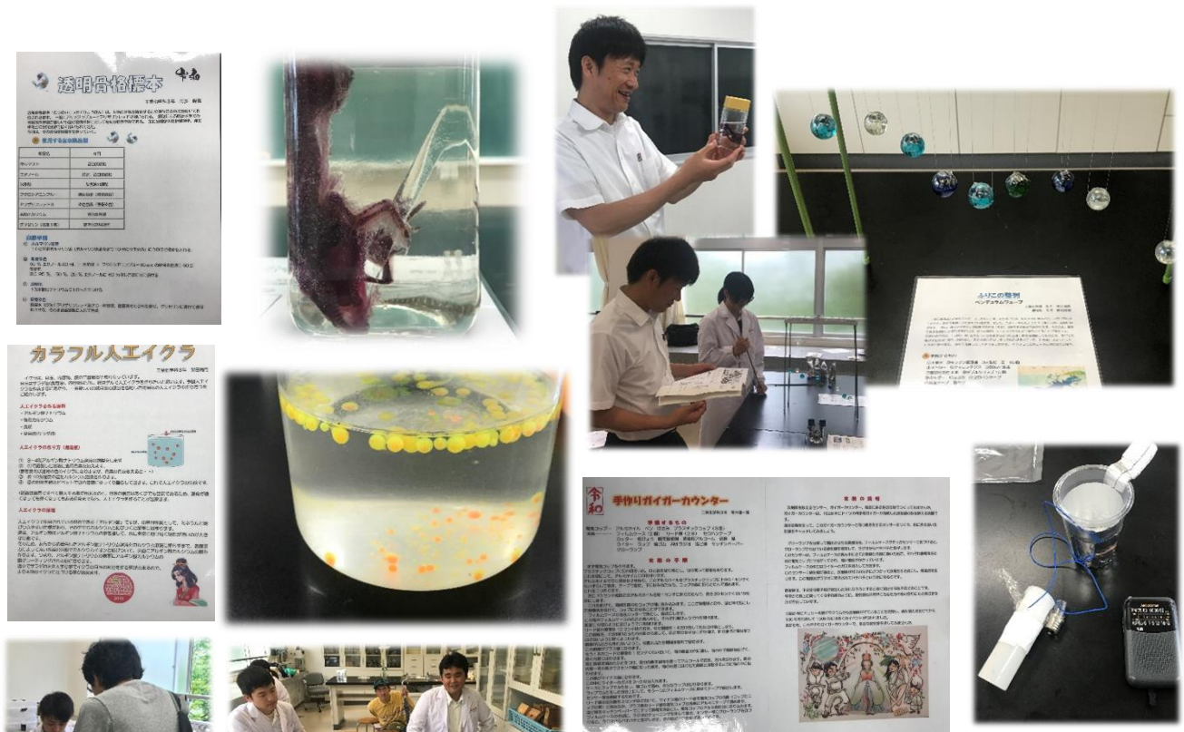
一般公開の様子です。

科学部は、6月16日（土曜日）の香工祭で、工業化学科の物理化学実習室で科学実験の展示と実演を行いました。今年も小学生や中学生対象の科学教室で行なう実験をテーマに、部員たちがアイデアを出し合い、様々な実験に取り組みました。